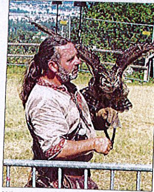
Winnie, un bel hibou, a charmé le public d'un battement d'aile.