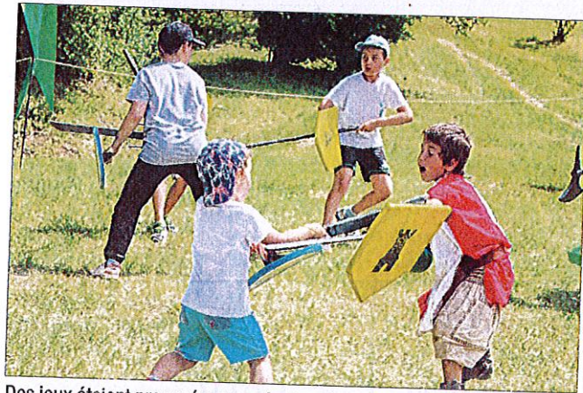
Des jeux étaient proposés aux enfants qui pouvaient se prendre pour des petits chevaliers en herbe.