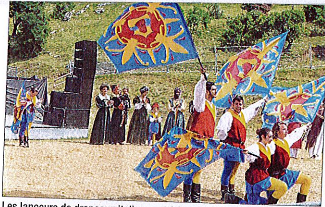
Les lanceurs de drapeaux italiens ont fait sensation.