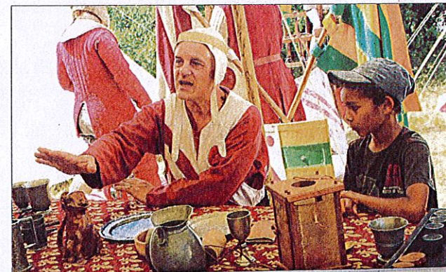
LA BOUQUETIÈRE APPRENANT À LA MANIÈRE D'UN CHEVALIER.