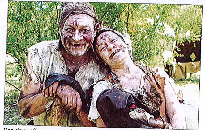
Ces deux affreux vous saluent bien bas !