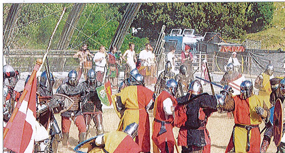
S.V. Les chevaliers se sont affrontés avec bravoure.

tion d'une association de protection des animaux qui distribuait des tracts en bas du site. Les spectateurs, quant à eux, n'ont visiblement pas boudé leur plaisir lors des brèves représentations de l'animal. La mêlée qui voit s'affronter les chevaliers des troupes médiévistes a tenu toutes ses promesses. Les enfants étaient aussi de la fête pour combattre valeureusement - et gentiment - leurs parents épée à la main façon guerre des houtons. Le spectacle son et lumière a conclu chaque soir de belle façon devant un public venu en nombre.