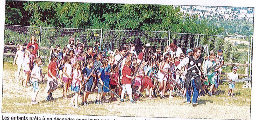
Les enfants prêts à en découdre avec leurs parents, avant la mêlée, façon guerre des boutons.